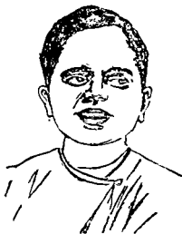
बालक लोकमान्य तिलक

तोप-तीर-तलवारों से भी, जिस ने कभी न डरना सीखा । काँटों के ऊपर चल करके, या स्वदेश पर भरना सीखा ।